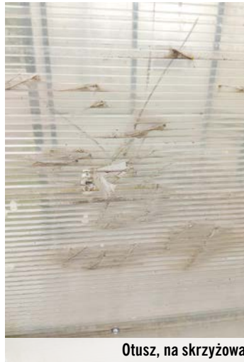
Otusz, na skrzyżowaniu z droga powiatową