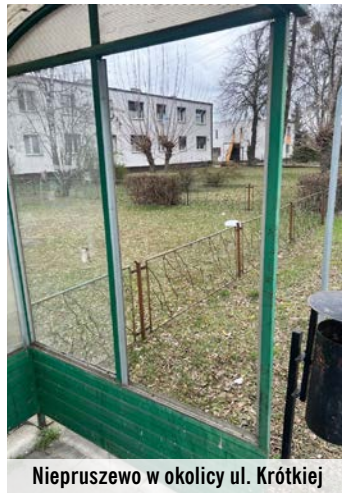
Niepruszewo w okolicy ul. Krótkiej