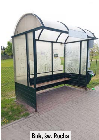
Buk, św. Rocha