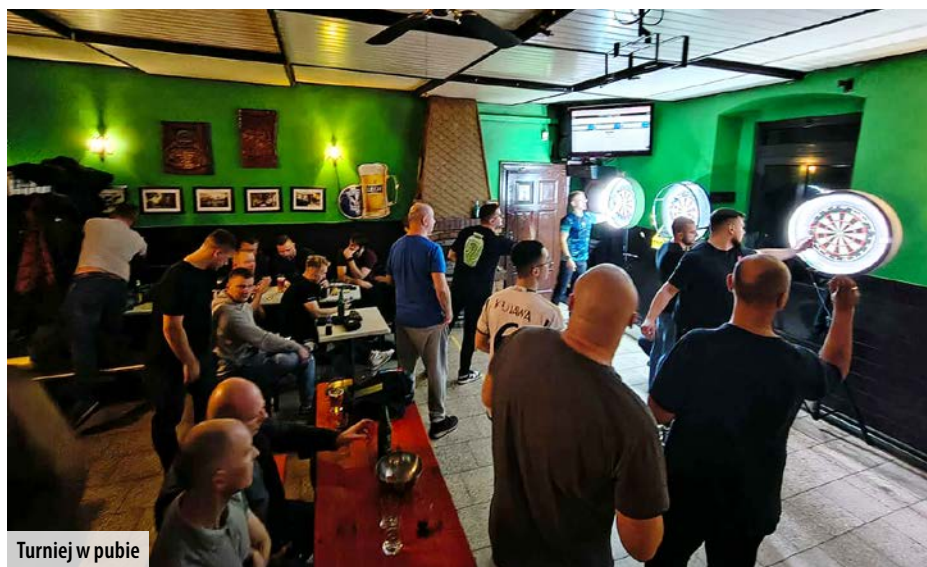
Turniej w pubie

Dart, niegdyś kojarzony głównie z zaciszem pubów, oficjalnie wkracza na lokalne salony sportowe. Z ogromną radością ogłaszamy powstanie nowej sekcji darta, w ramach której w salce klubowej oraz w Pubie Fizkasz spotykają się cyklicznie entuzjaści rzucania do tarczy.