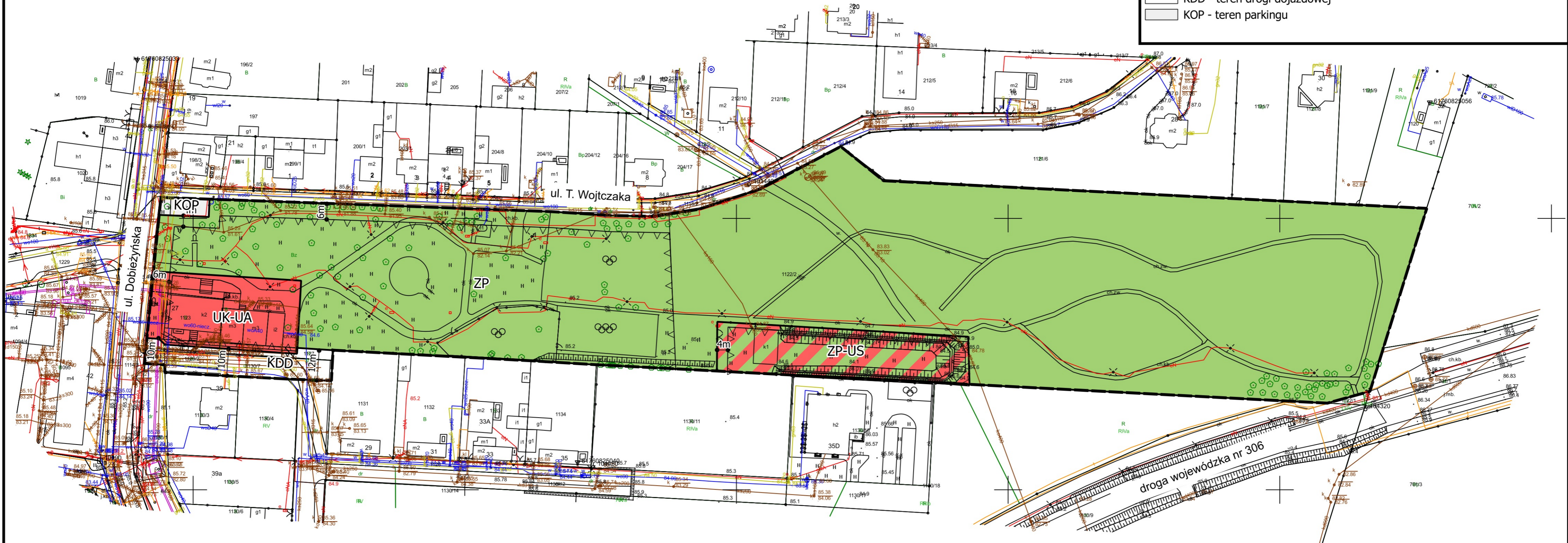
WYRYS ZE STUDIUM UWARNKOWAŃ I KIERUNKÓW ZAGOSPODAROWANIA PRZESTRZENNEGO MIASTA I GMINY BUK SKALA 1:10000