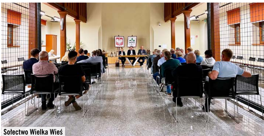
Sołectwo Wielka Wieś

Sołtysi przedstawiali bieżące wykonanie środków z Funduszu Sołeckiego oraz propozycje przeznaczenia tych funduszy w 2025 roku – przede wszystkim na organizację wydarzeń kulturalnych, folklorystycznych, podtrzymujących lokalną tradycję oraz sportowych. Działania te mają na celu aktywizację różnych grup wiekowych – promowanie aktywnego i rodzinnego spędzania czasu. Na zebraniach wiejskich podjęto stosowne uchwały dotyczącą przeznaczenia środków Funduszu Sołeckiego w 2025 roku.