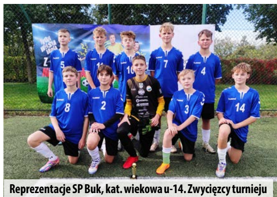
Reprezentacje SP Buk, kat. wiekowa u-14. Zwycięzcy turnieju