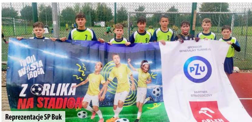
Reprezentacje SP Buk