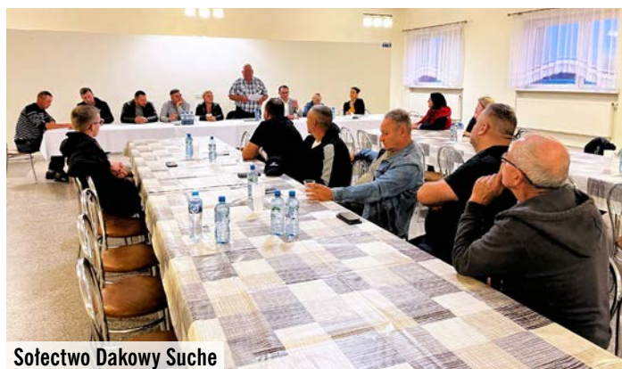
Sołectwo Dakowy Suche