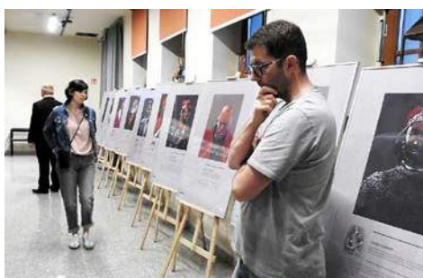
Noc Muzeów znów zaskoczyła! str. 19-21