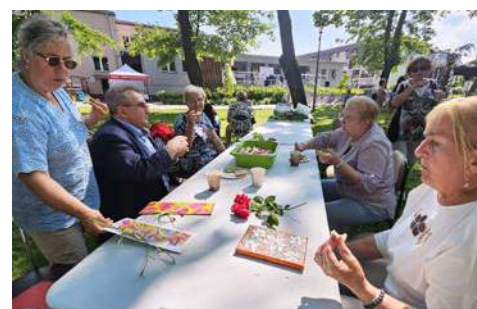
Spacer z kulturą i... talentami str. 22-23