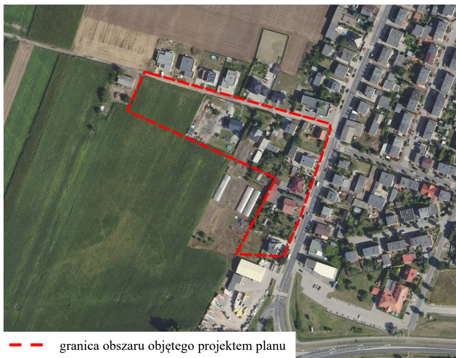
Ryc. 1. Lokalizacja obszaru objętego projektem planu na tle ortofotomapy

Obszar opracowania projektu planu położony jest w miejscowościach Wielka Wieś i Buk, w rejonie ulic: Grodziskiej i Łąkowej. Jego powierzchnia wynosi ok. 1,7 ha. Większość przedmiotowego terenu jest zainwestowana – występuje zabudowa mieszkaniowa jednorodzinna (Ryc. 1.). W ciągach ulic: Grodziskiej i Łąkowej funkcjonuje sieć wodociągowa, kanalizacji sanitarnej, elektroenergetyczna i gazowa. W sąsiedztwie przedmiotowego obszaru występują tereny zabudowy mieszkaniowej jednorodzinnej, tereny zabudowy mieszkaniowo-usługowej, tereny zabudowy usługowej oraz tereny użytkowane rolniczo. Wzdłuż wschodniej granicy obszaru opracowania przebiega droga powiatowa nr 2497P – ul. Grodziska.