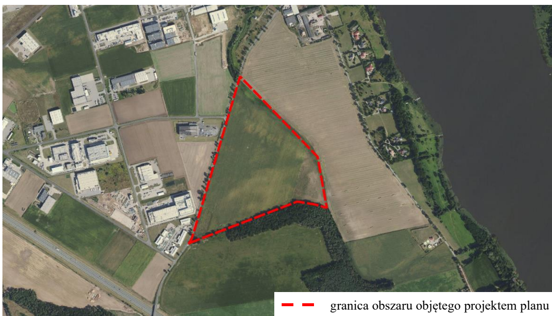
Ryc. 1. Lokalizacja obszaru objętego projektem planu na tle ortofotomapy

Obszar opracowania projektu planu położony jest w miejscowości Niepruszewo, po wschodniej stronie drogi powiatowej nr 2500P – ulicy Starowiejskiej. Obejmuje działki o numerach ewid.: 305, 306/9, 306/11, 306/12, 306/14, 306/15, 306/16, 306/17 o łącznej powierzchni ok. 22,6 ha. Przedmiotowy teren jest niezabudowany, użytkowany rolniczo. W sąsiedztwie przedmiotowego obszaru występują tereny zabudowy produkcyjno-usługowej, tereny zabudowy mieszkaniowej jednorodzinnej, tereny użytkowane rolniczo, tereny lasu oraz Jezioro Niepruszewskie. W odległości ok. 300 m na południe od przedmiotowego obszaru przebiega autostrada A2 (Ryc. 1.).