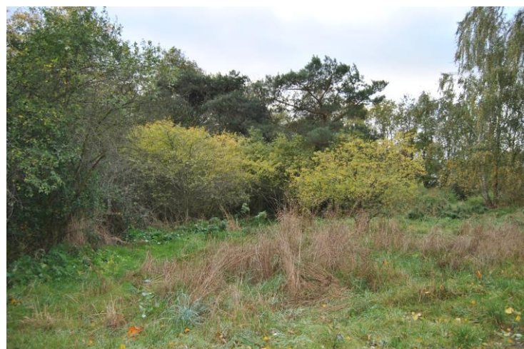
Miejsce do zagospodarowania