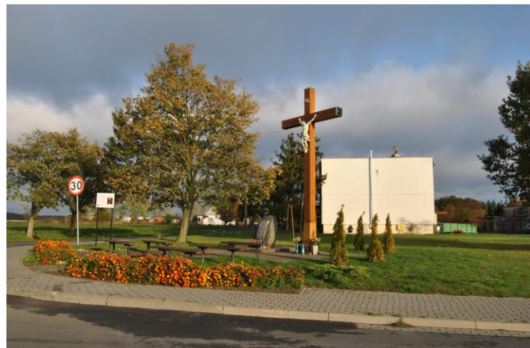
Miejsce kultury religijnego