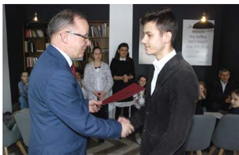
Nagrody sportowe str. 2-3