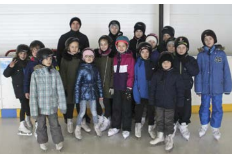
Ferie w mieście str. 18-20