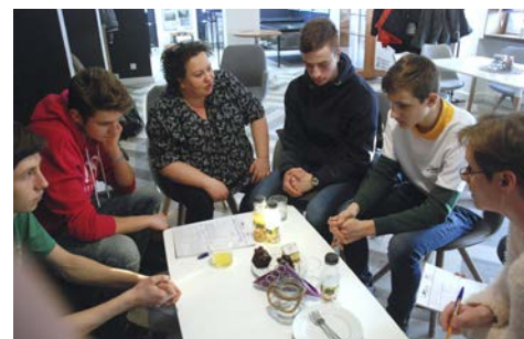
Nakręca film o Powstańcach Wielkopolskich str. 10